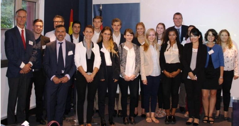
z. B. AHK Spanien: Teilnahme der FEDA-Azubis am Seminar „Werte im Unternehmen - ein Erfolgsfaktor“, September 2016

Weitere Infos und eine Auflistung der letzten Veranstaltungen finden Sie hier :