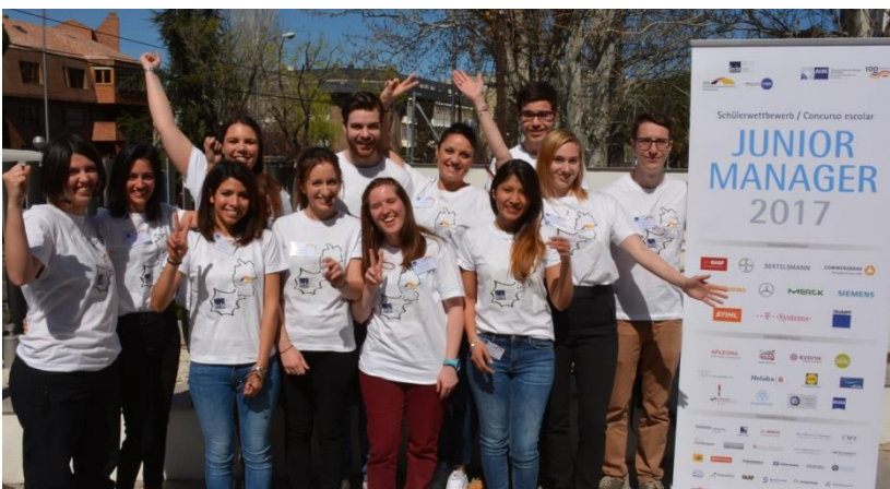
Azubis der FEDA Madrid organisieren den Business-Wettbewerb 2017 mit der AHK Spanien und Liebherr Ibérica